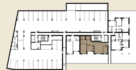
PLANTA PISO 01