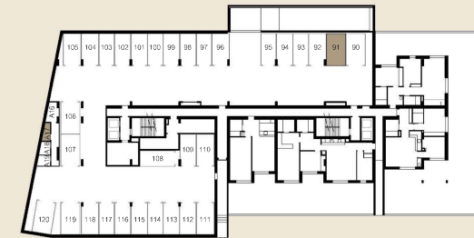
PLANTA PISO -1

Local: Rua 14 de Outubro e Rua José Meneres