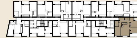
PLANTA PISO 4