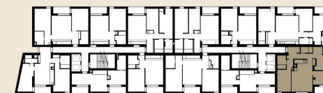
PLANTA PISO 6