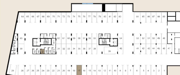
PLANTA PISO -2

Local: Rua 14 de Outubro e Rua José Meneres