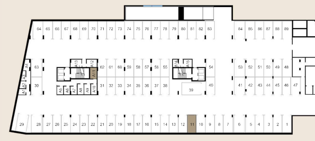
PLANTA PISO -2

Local: Rua 14 de Outubro e Rua José Meneres Data: janeiro 2025 | REV01 Fração: CZ Piso: 8